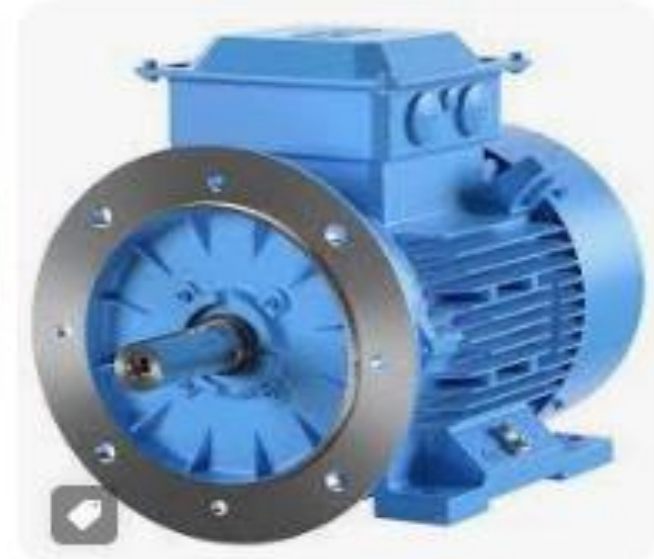
ABB eMart · En stock ABB IE2 9.3 kW Induction ...