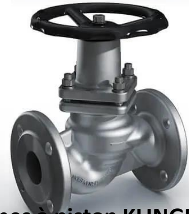
Vannes à piston KLINGER