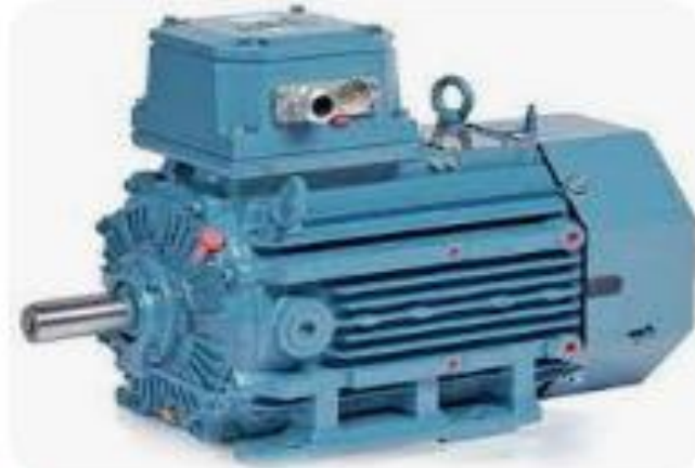
Dietz Electric Co., Inc. ABB Motors - Dietz Electric...