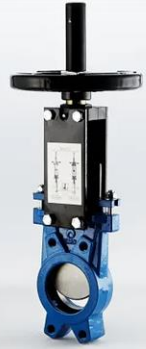
Vannes à guillotine