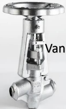
Vannes à piston