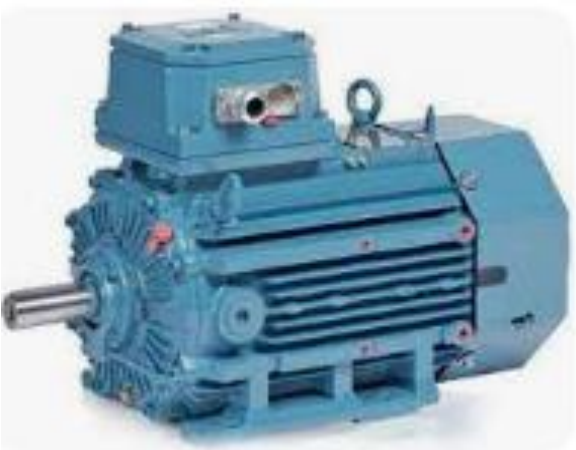
Dietz Electric Co., Inc. ABB Motors - Dietz Electric...