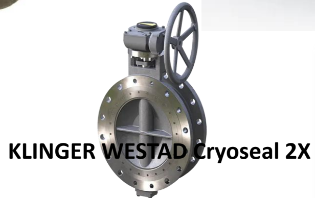
KLINGER WESTAD Cryoseal 2X