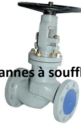
Vannes à soufflet