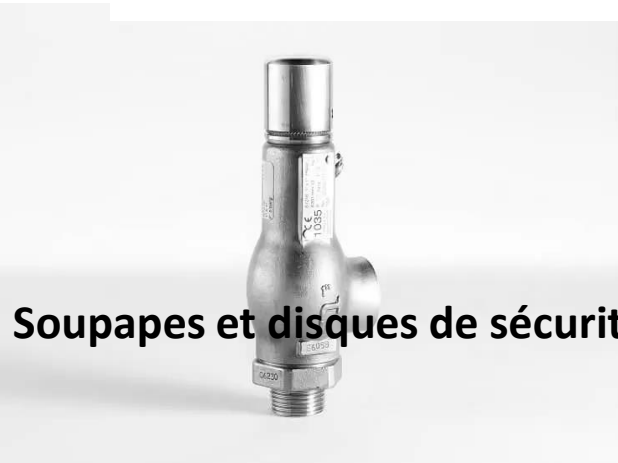
Soupapes et disques de sécurité