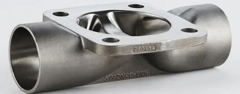
Vannes à membrane/à manchon