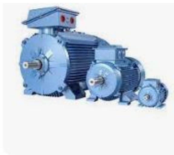
DirectIndustry Three-phase motor - M2BA...