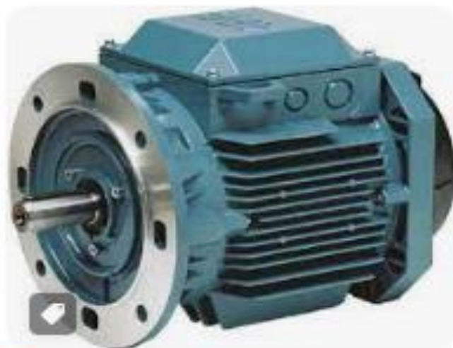
RS Export · En stock 3GAA082 311-BSE ABB | ...