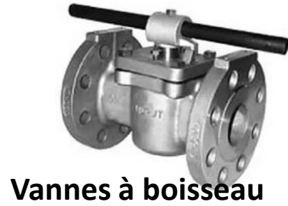
Vannes à boisseau